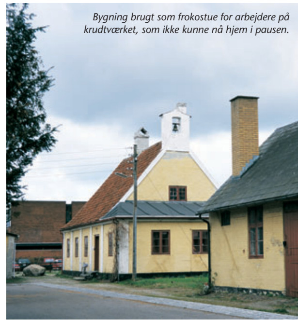
Bygning brugt som frokostue for arbejdere på krudtværket, som ikke kunne nå hjem i pausen.