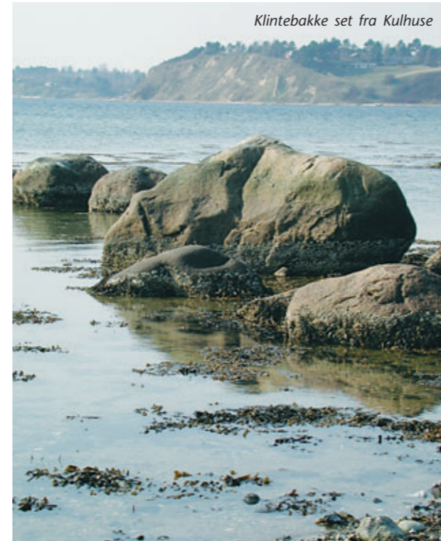
Klintebakke set fra Kulhuse

med Kattegat. Langs bakkeformationerne Storebjerg og Lyngbakkerne mellem Lynæs og Hundested og ved Klintebakken (6) i Lynæs, kan du se skræntdannelserne, som følger stenalderhavets afgrænsning. Ved Grønnesse Skov følger vandrestien toppen af kystskrænten (7), der her ligger langt tilbage fra den nuværende fjordkyst. Mange af de tidligere fjordindskæringer er idag tørlagte og opdyrkede, eller henligger som mose, og engarealer.