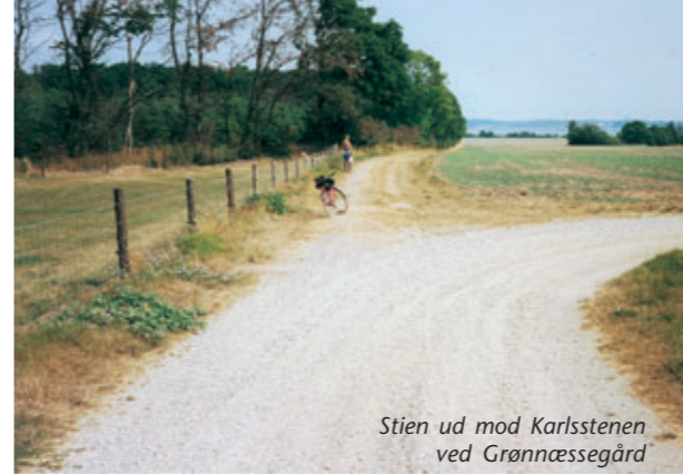
Stien ud mod Karlsstenen ved Grønnessegård

Siden den tidligste Jægerstenalder, 10.000 år f.Kr., har der har været bosættelser langs Roskilde Fjord. Mange af bopladserne ligger idag på de tidligere landarealer på bunden af Roskilde Fjord. Ved Sølager, på det der i Stenalderen var havskrænten, ligger en fredet køkkenmødding, som har givet rige fund fra Ertebøllekulturen (ca. år 4.500 f.Kr.).